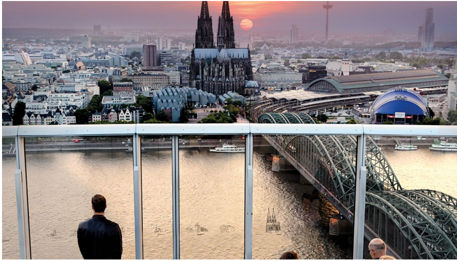
Axel Schulten - Axel Schulten