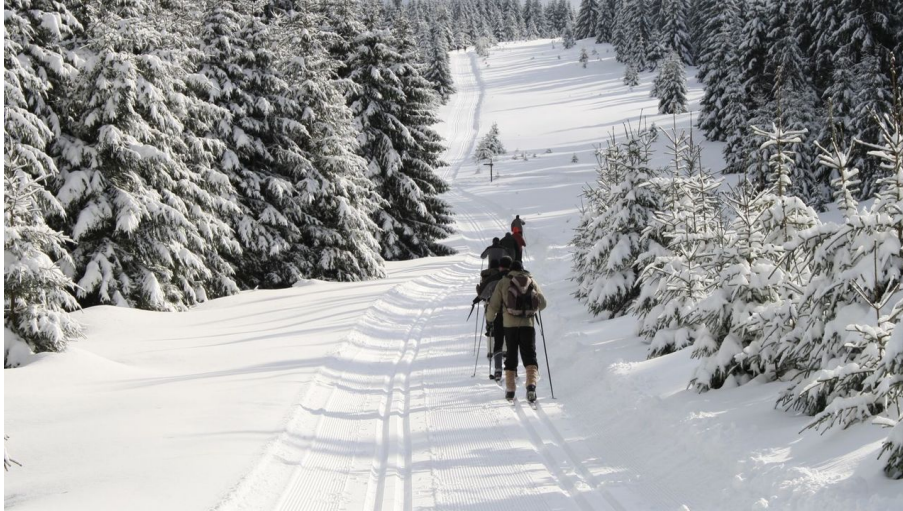
Langlauf in Schierke - © Wernigerode Tourismus GmbH