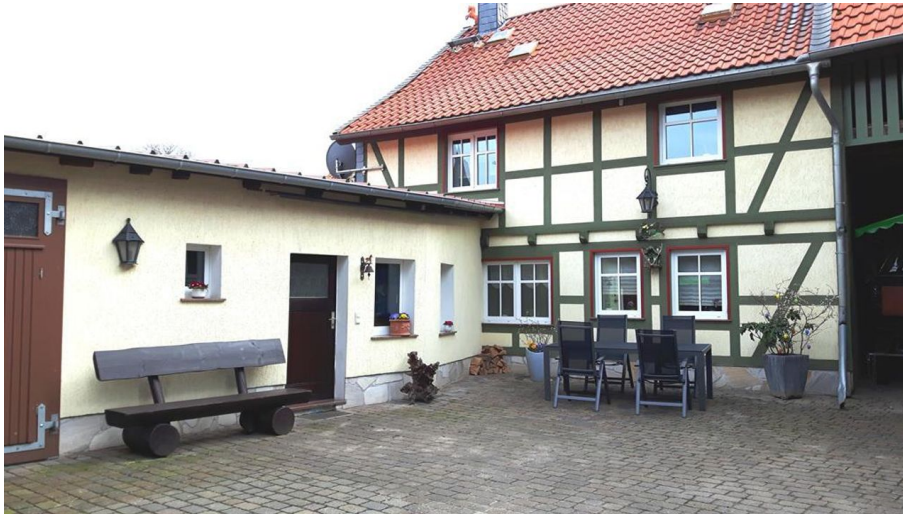
Haus und Hof