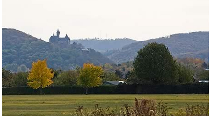
Blick Richtung Stadt und Schloss