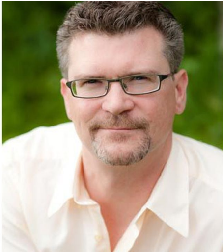
Richard Geisberger - © Richard Geisberger