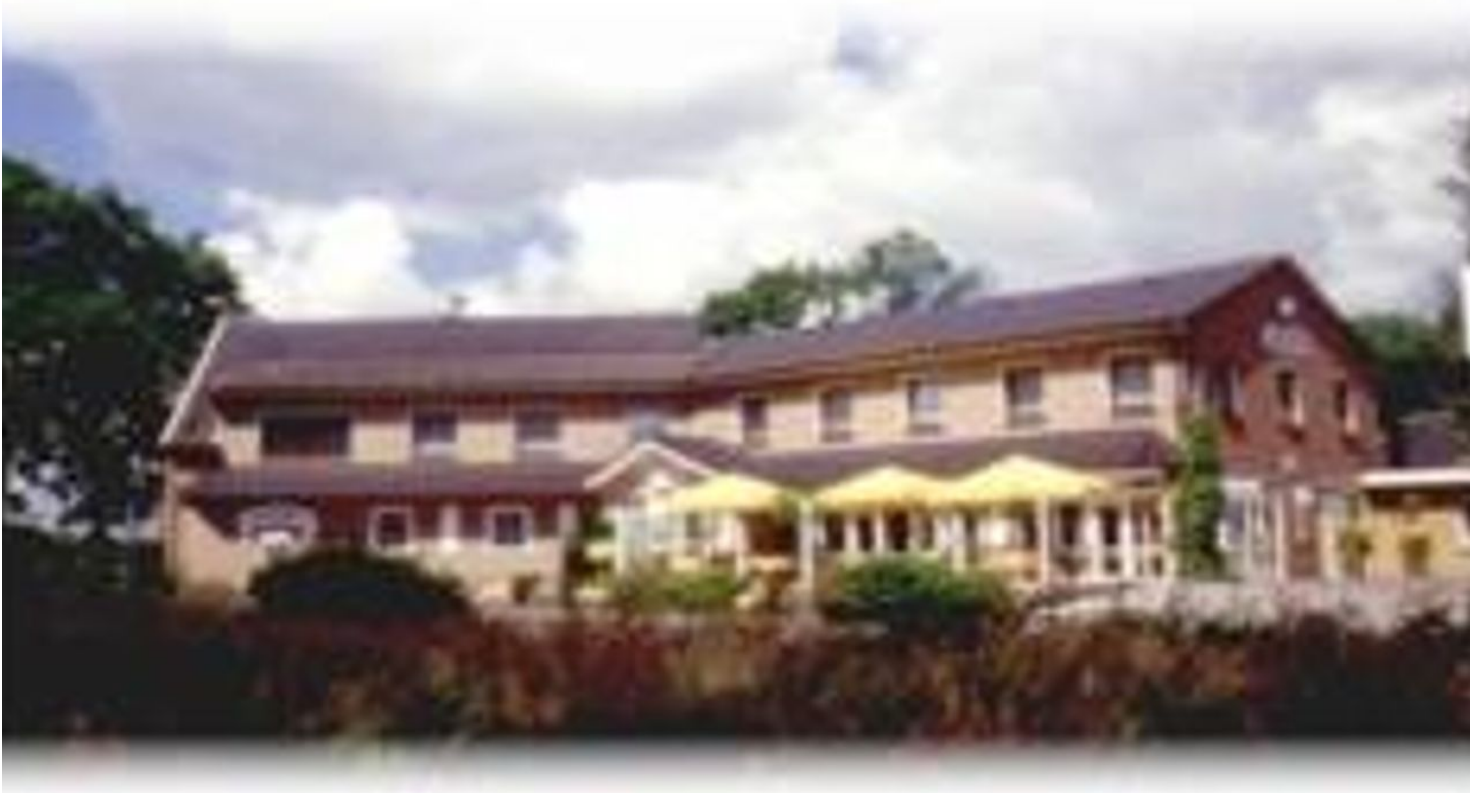
Impressionen - © Gerrit Reil