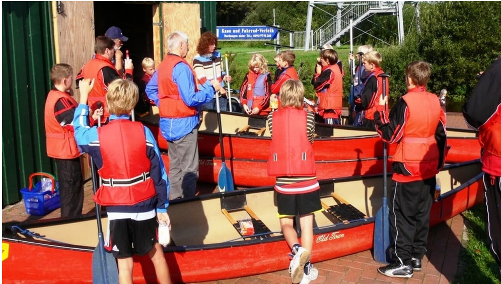
Einweisung einer Schulklasse