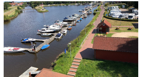
Hafen Barßel mit Kanuanleger im Vordergrund - © Arno Ewen, Touristik GmbH Südliches Ostfriesland