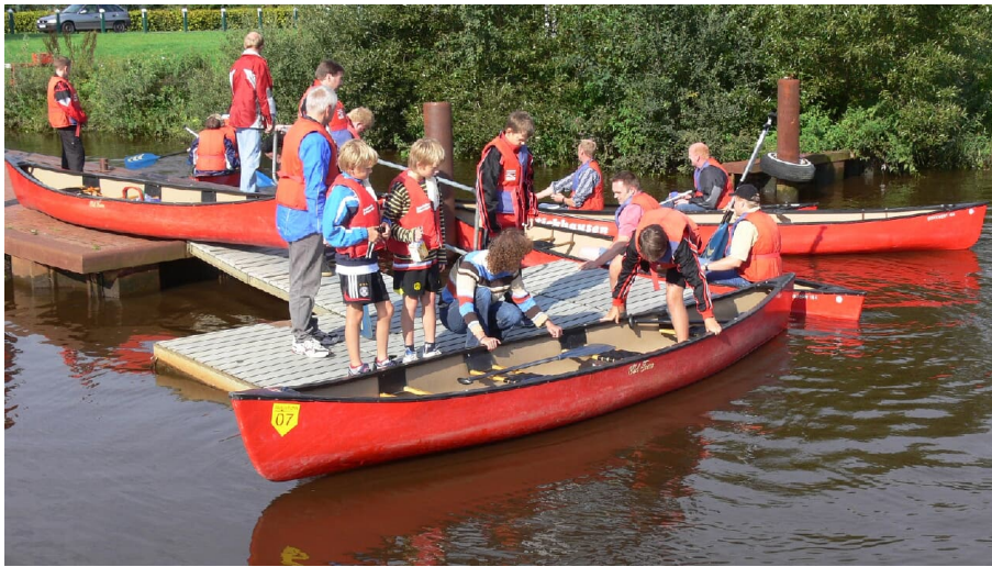
Gleich gehts los