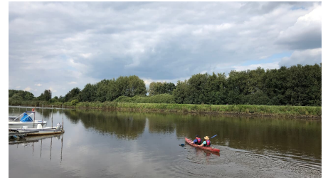
Kanufahrer starten in Barßel