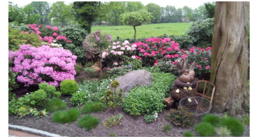
Blick in den Garten - © Wolfgang Krüger