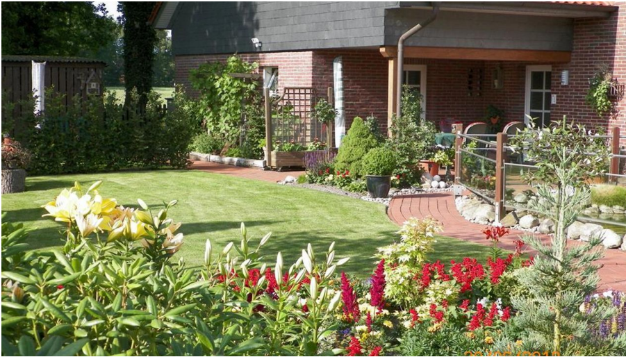
Veranda u. Teil des Gartens - © Wolfgang Krüger