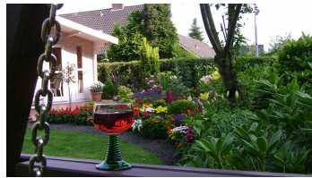
Tagesausklang im Garten