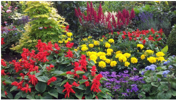
Blick in den Garten - © Wolfgang Krüger