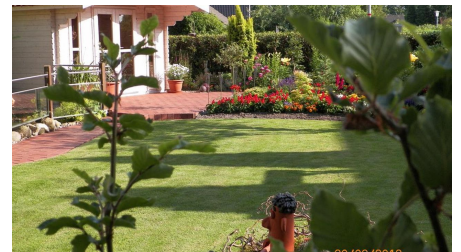
Blick in den Garten - © Wolfgang Krüger