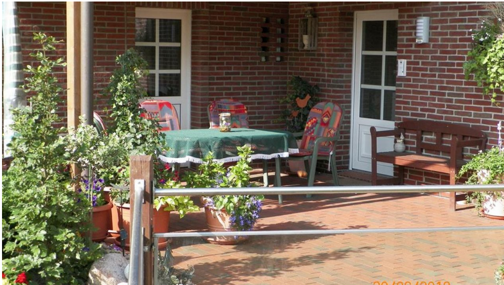
Veranda u. Eingangsbereich FeWo