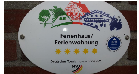
F***** (fünf Sterne) - © Wolfgang Krüger