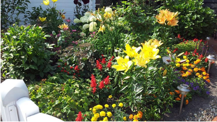
Blick in den Garten - © Wolfgang Krüger