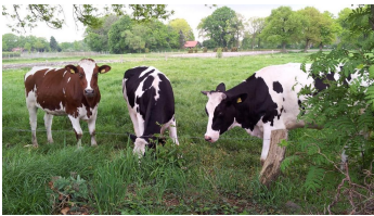
Unsere "Nachbarn"