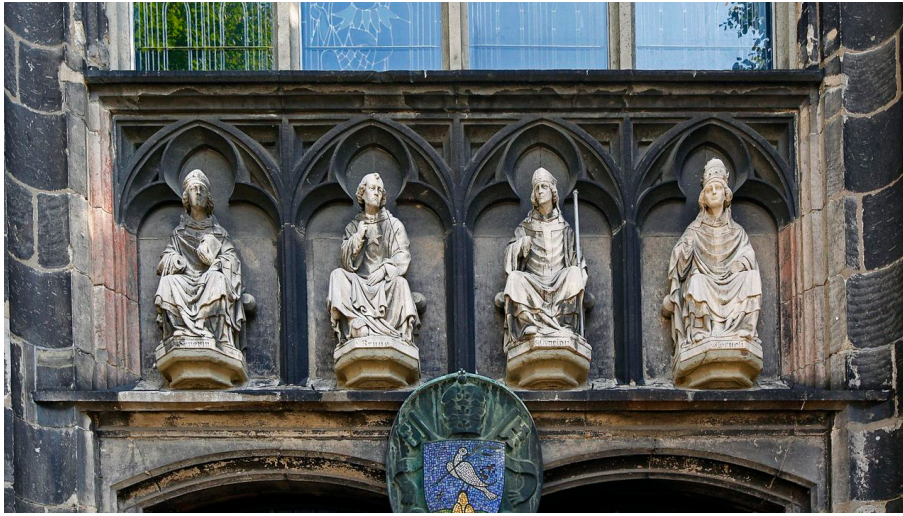
Udo Haake - Udo Haake