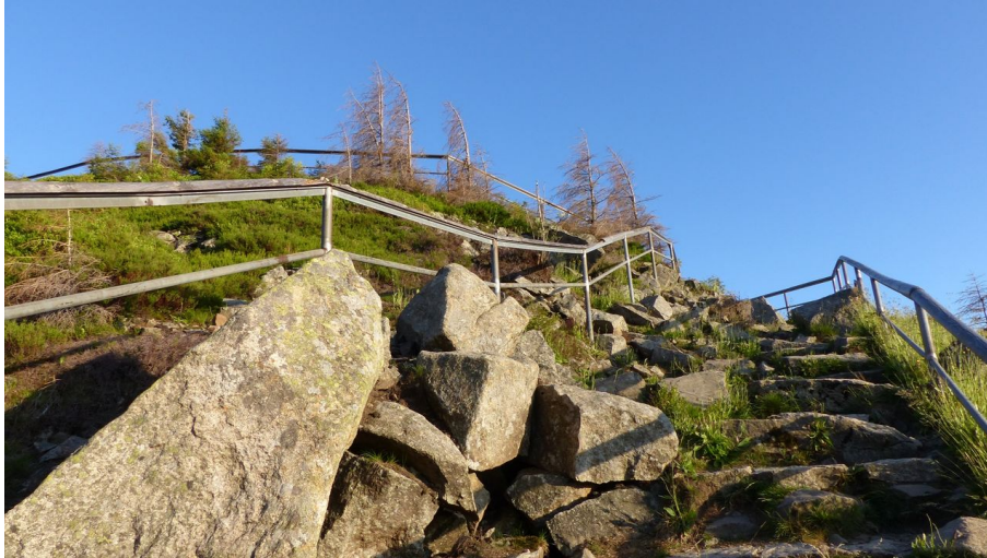
Die Achtermannshöhe liegt ebenfalls am Weg und sollte bestiegen werden.