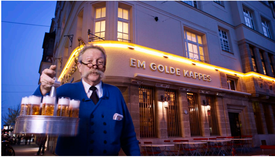
Cölnler Hofbräu Früh