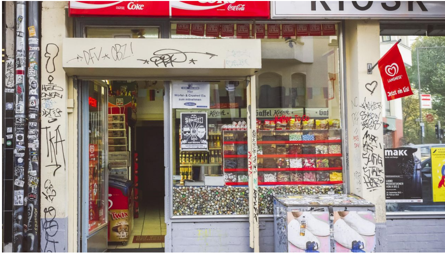
tomas - Bilderblitz