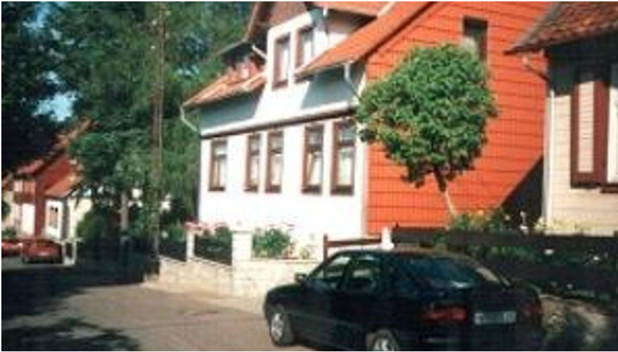
Lau - Ferienwohnung