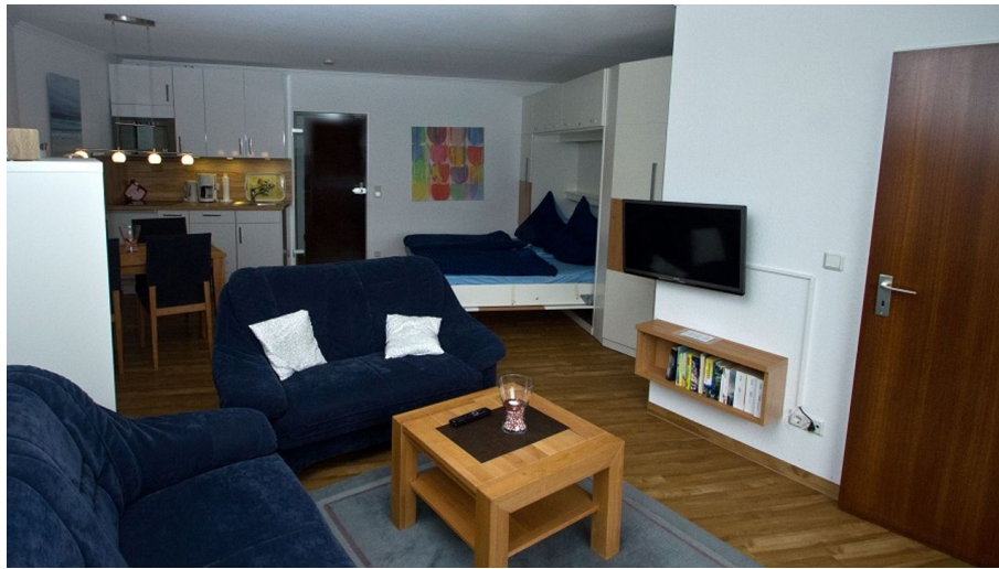
LORD NELSON 118