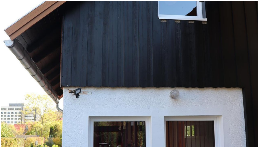
Ansicht vom Grundstückseingang