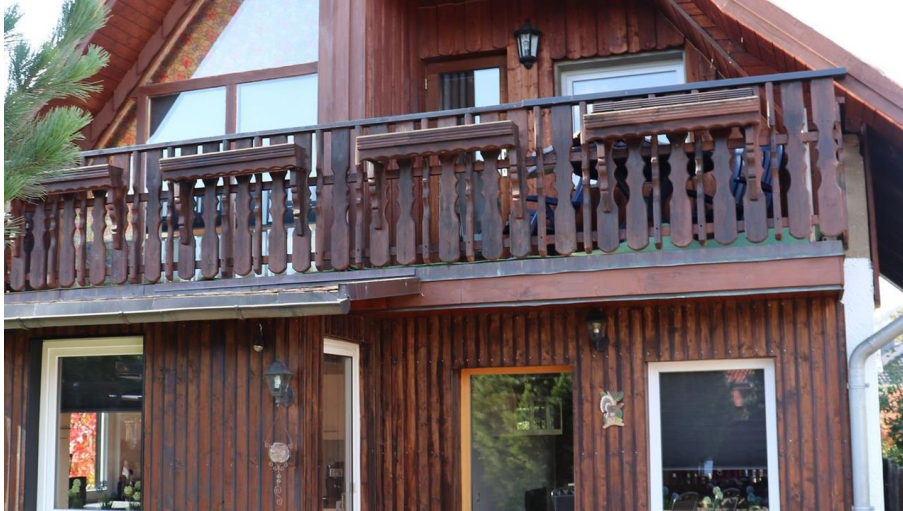
Hausansicht vom Garten