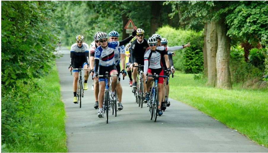
Gerhard Sander, Ostfriesland Tourismus