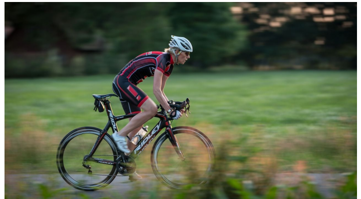
Gerhard Sander, Ostfriesland Tourismus