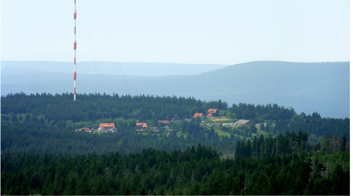
Blick vom Goetheweg nach Torfhaus