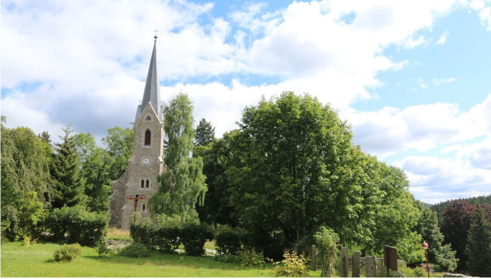
Bergkirche Schierke