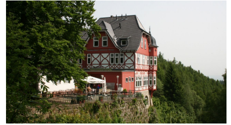
Steinerne Renne, Gasthaus