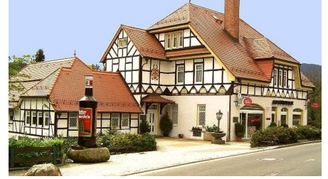
Stammhaus Schierker Feuerstein