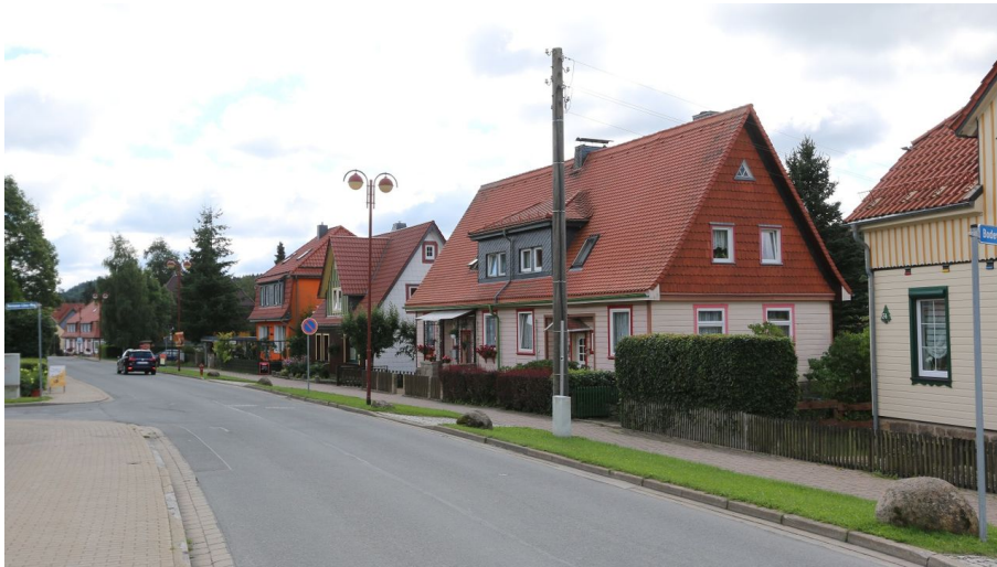
Ortsansicht Schierke