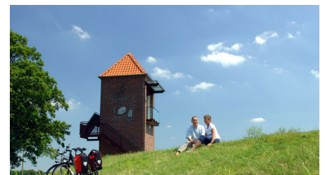
Landschaftsfenster Wasser in Tange