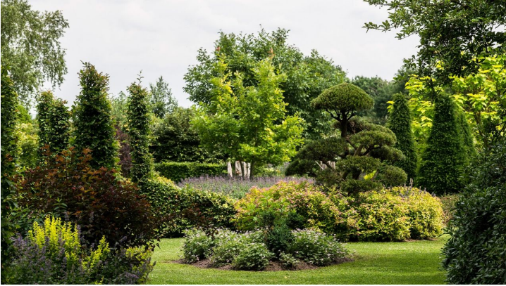
Landhof Tausendschön, Gastrotipp für Sonntage