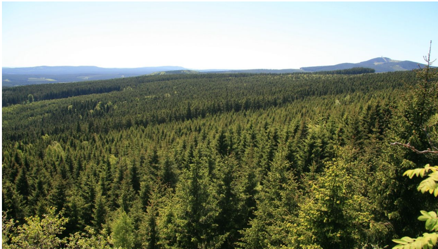
Ausblick vom Trudenstein