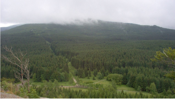
Blick vom Scharfenstein auf den Brocken