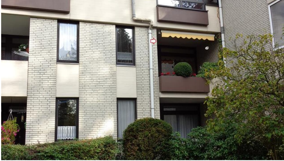
Ansicht vom Haus 1. OG gelbe Markise