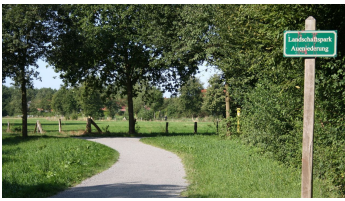
Ammerland Touristik, Ostfriesland Tourismus