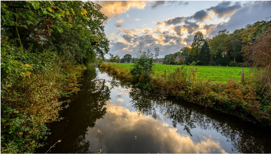
M. Greilich Fotoclub Westerstede, Ostfriesland Tourismus