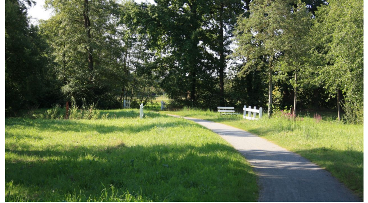
Ammerland Touristik, Ostfriesland Tourismus