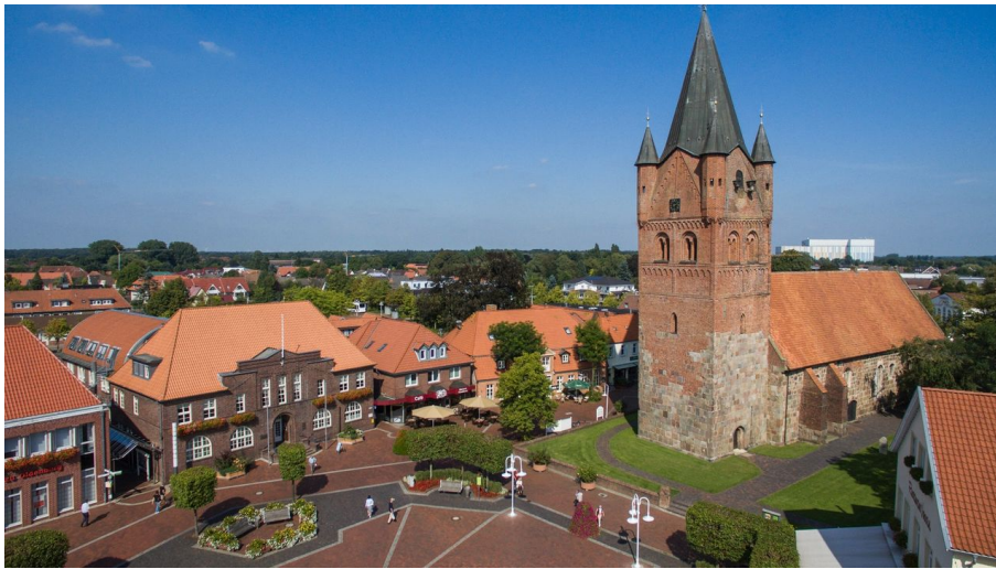
Luftaufnahme Innenstadt Westerstede