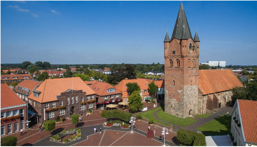
Luftaufnahme Innenstadt Westerstede