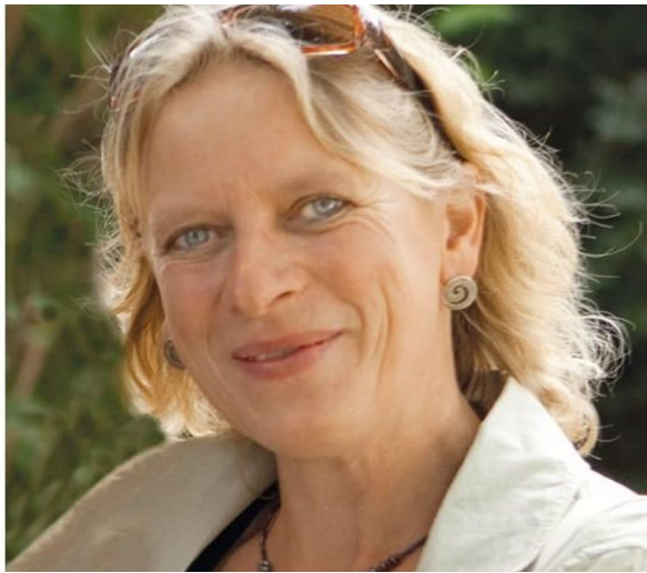
Angela Lichius