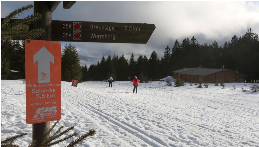
Winterberg Loipe