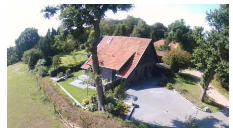
Außenansicht Haus 3