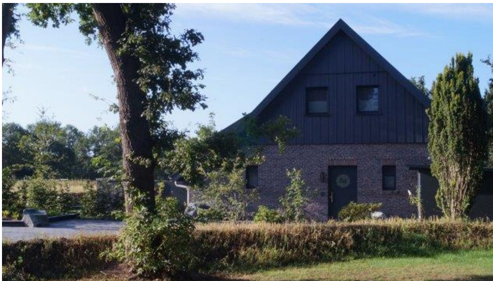
Außenansicht Haus 2