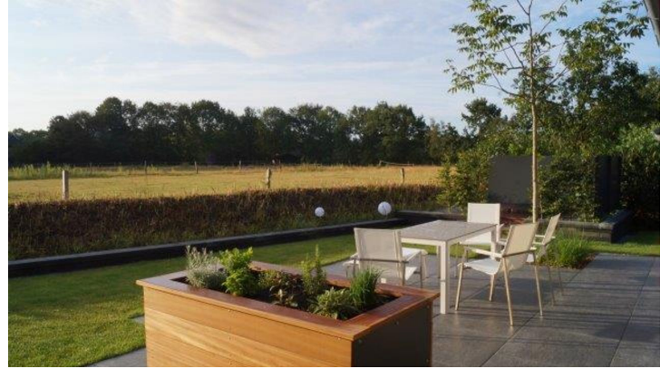
Terrasse Ausblick Wiese