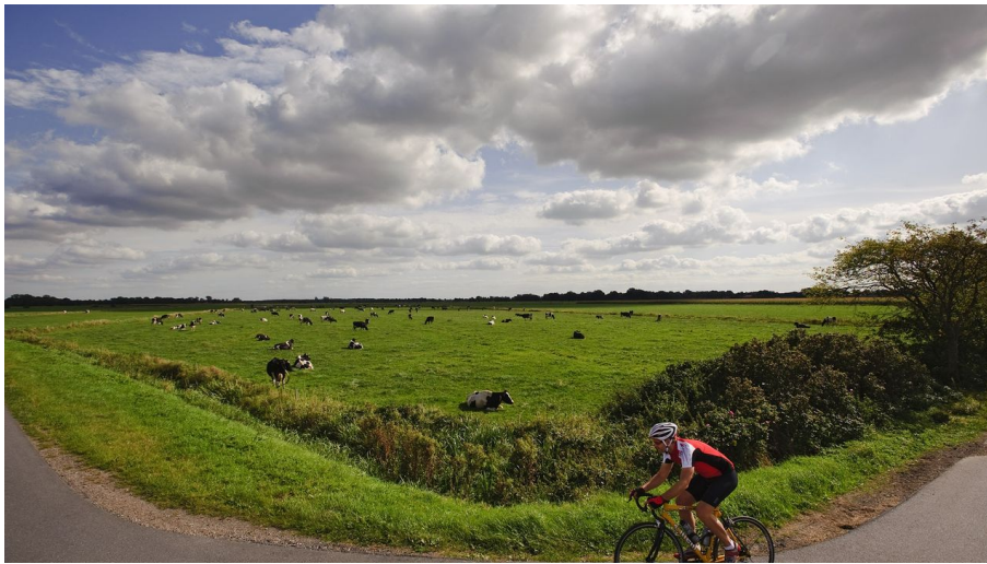
Durch die Fehnlandschaft in Richtung Leer