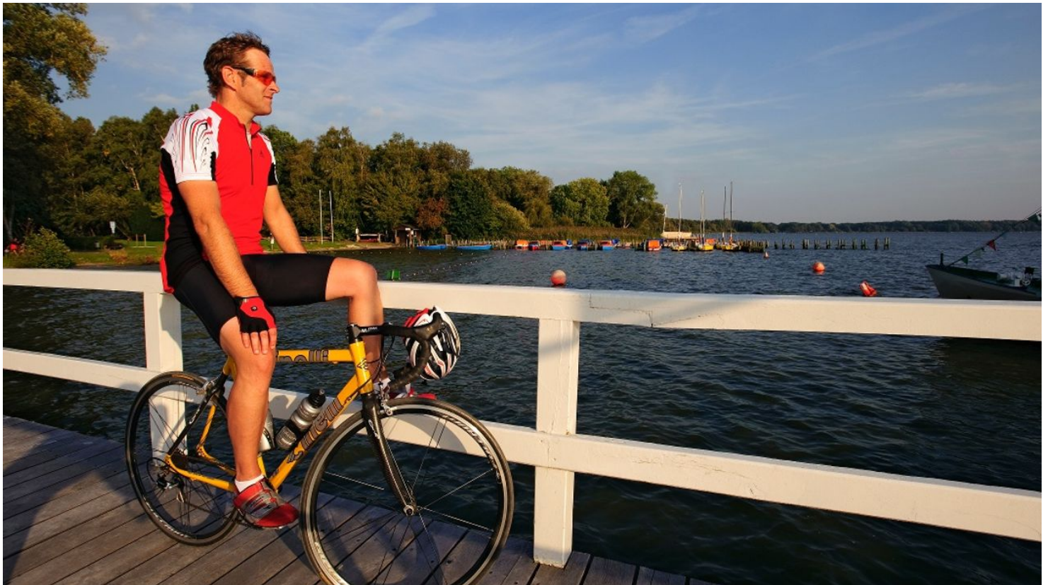
Pause am Zwischenahner Meer - © Ammerland Touristik, Martin Kirchner

Quelle: outdooractive.com ID: B9DEB60EA230E3A1D0404F95BB7DF030 Zuletzt geändert am 16.03.2022, 10:16