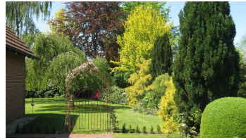
Eingang zum Garten