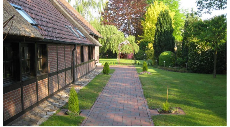
Zugang zur FeWo