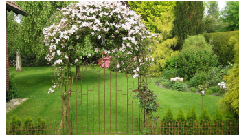
Eingang zum Garten