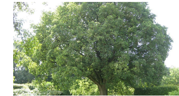
Eiche im Garten