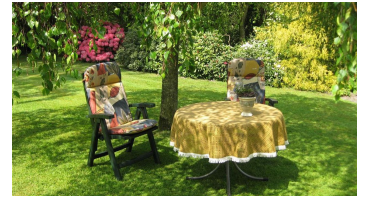
Sitzecke im Garten