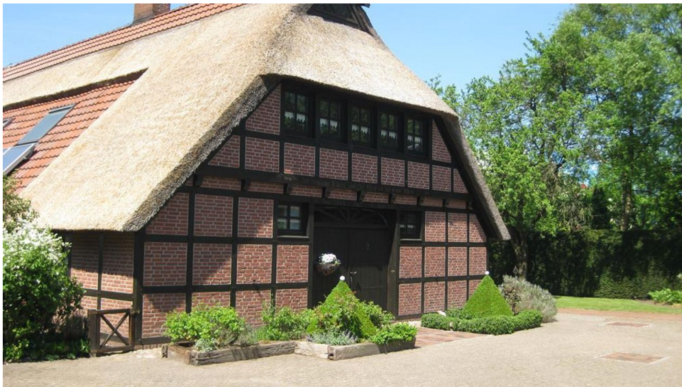
Seitensicht - © Hartmut Kuck