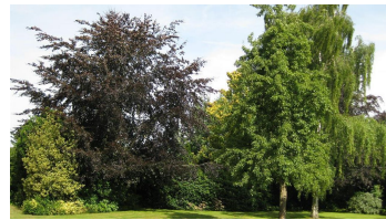
Garten - © Hartmut Kuck