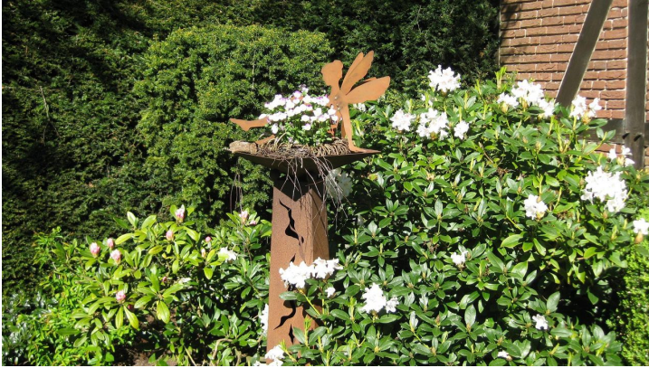
Gartenfee - © Hartmut Kuck