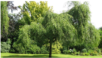
Garten - © Hartmut Kuck