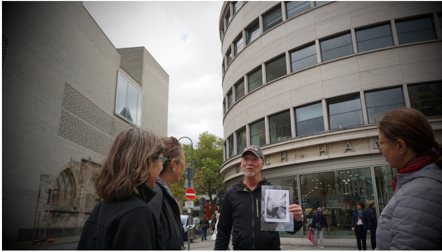
Denk nicht an morgen