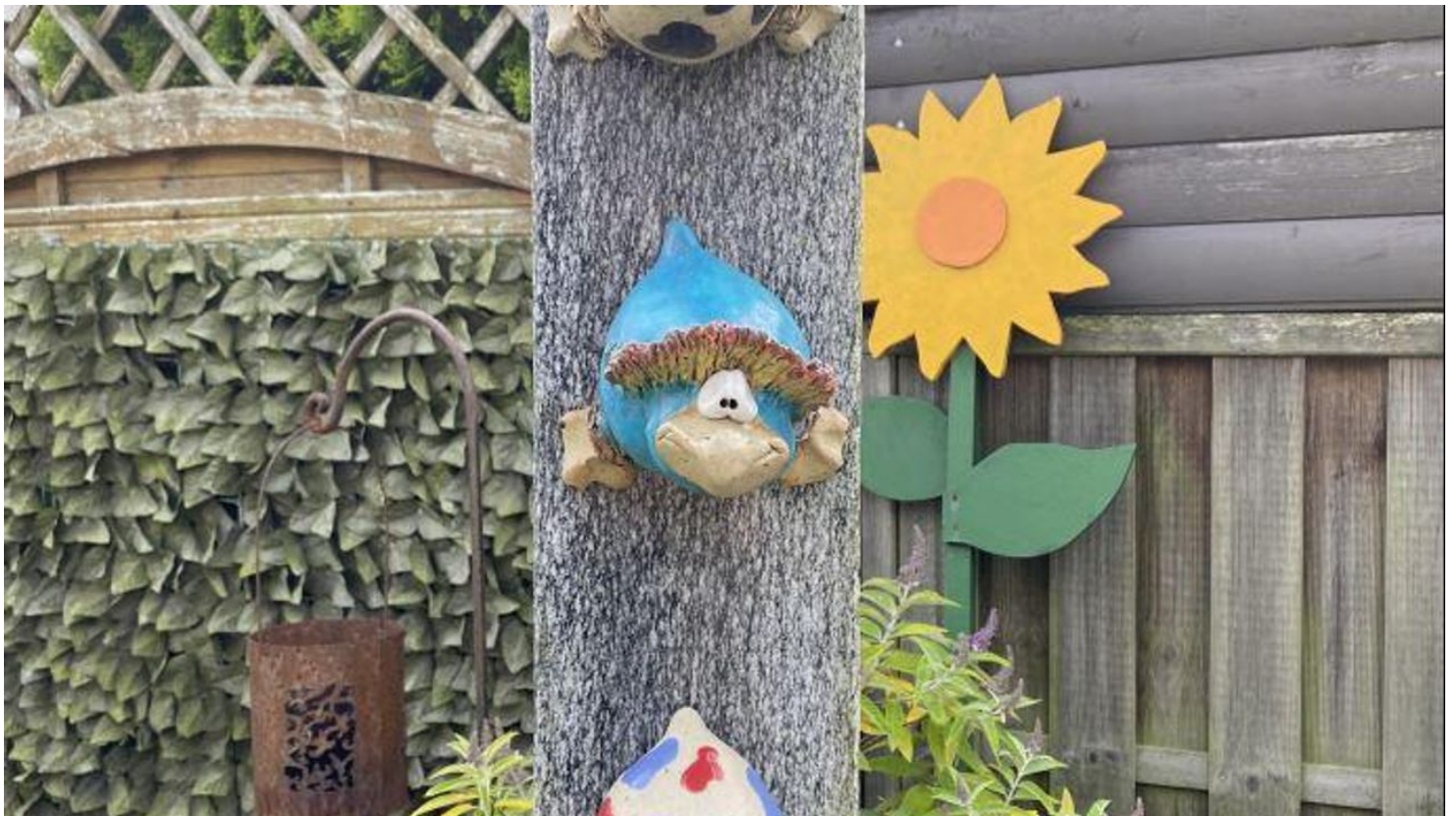
Figuren im Garten