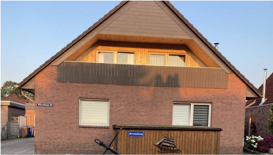
Aussenansicht Fewo Christa