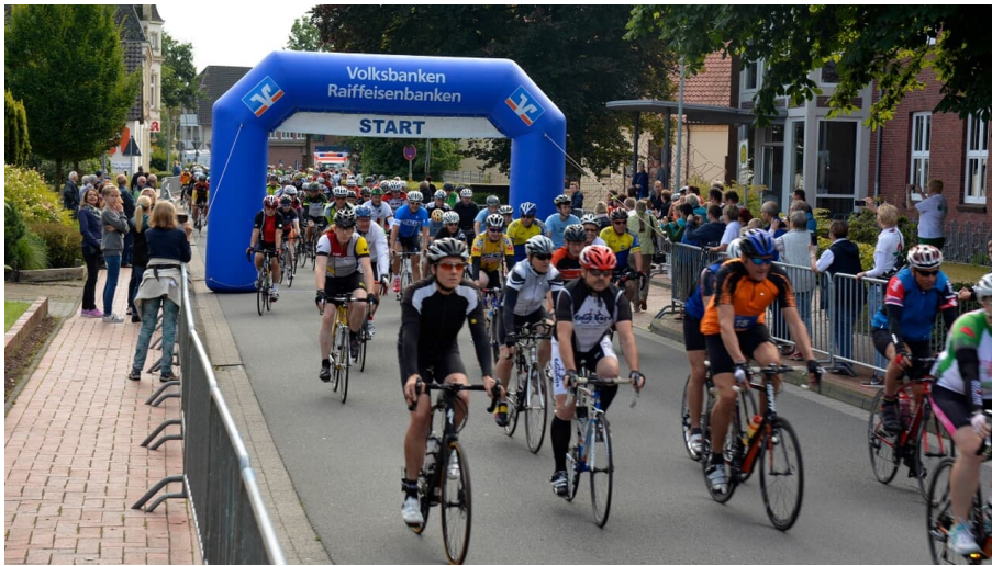
Start zur RTF Muskeltour