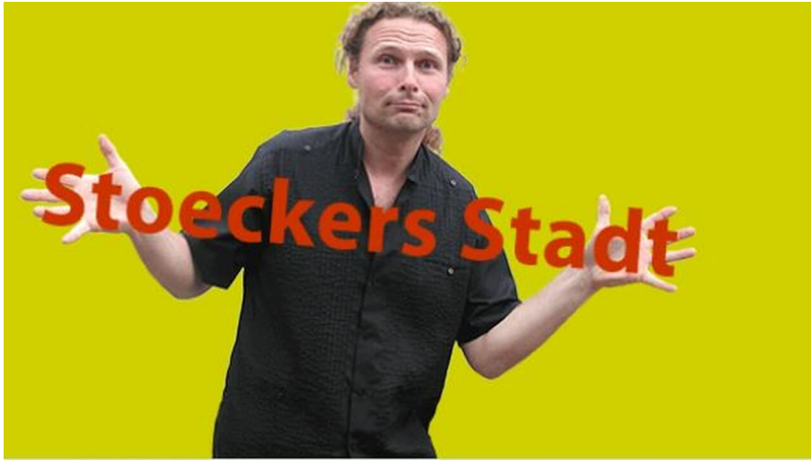
Reise in den Kölner Mikrokosmos