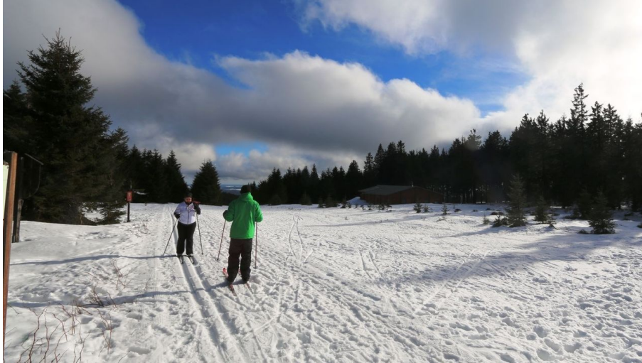
In der Loipe Schierke