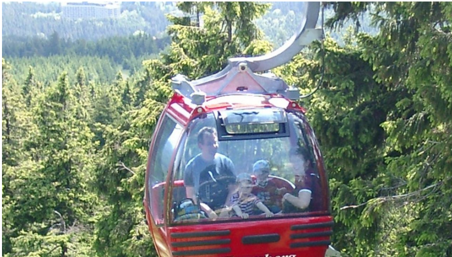
Kabinenbahn am Wurmberg