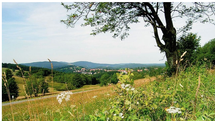
Blick auf Sankt Andreasberg