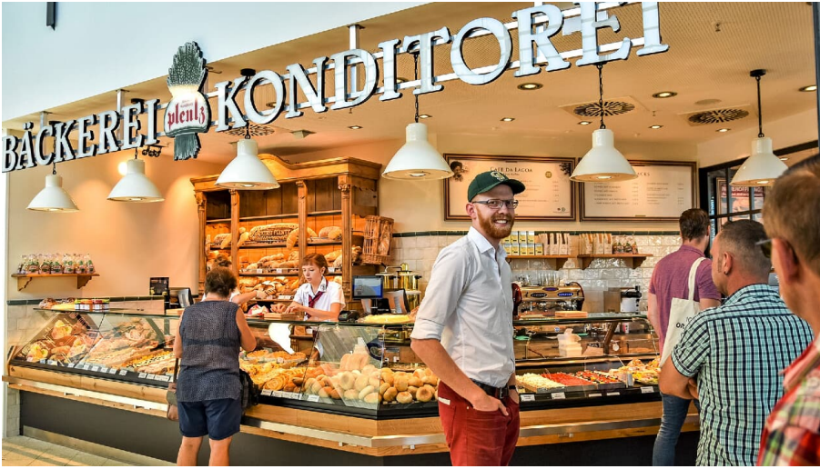
Bäckerei Plentz im Oranienpark, Friedensstraße