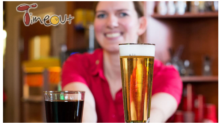
Sportsbar timeout