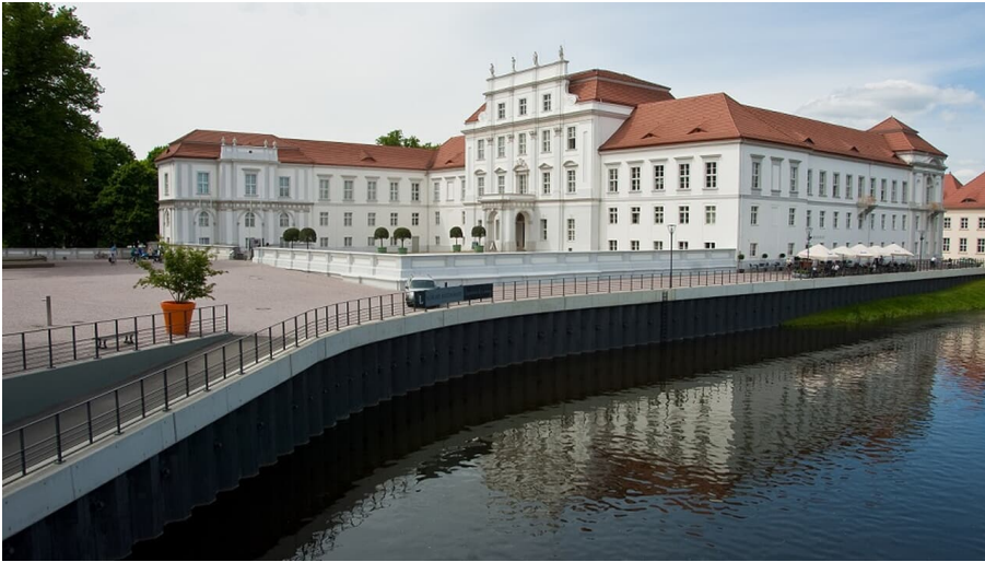
Schlossrestaurant "Lieschen & Louise"