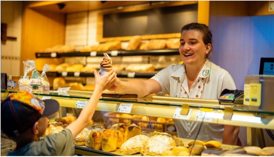
Bäckerei Plentz in Germendorf