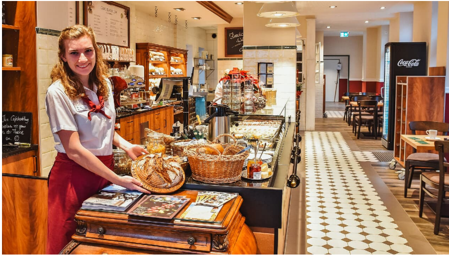
Bäckerei Plentz in der Breiten Straße