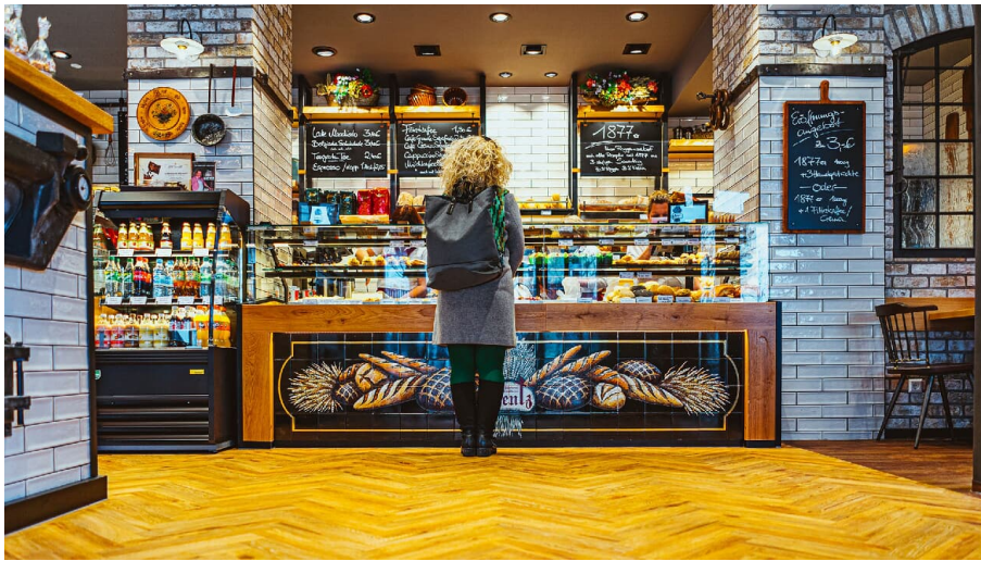
Bäckerei Plentz in der Bernauer Straße