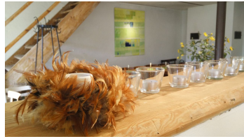
Biohof Ihlow