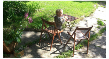
Biohof Ihlow - draußen