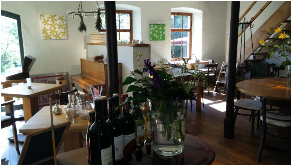
Biohof Ihlow

Feiertage: Christi Himmelfahrt: 10:00 - 19:00Pfungstsonntag: 10:00 - 19:0003.10. (Tag der deutschen Einheit): 10:00 - 19:00Pfungstmontag: 10:00 - 19:00