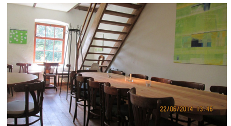
Biohof Ihlow - Café