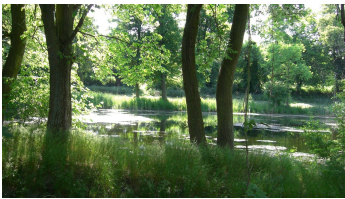
Biohof Ihlow - Teich