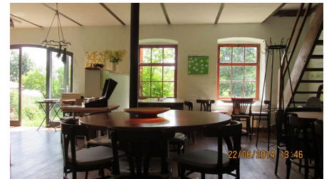
Biohof Ihlow