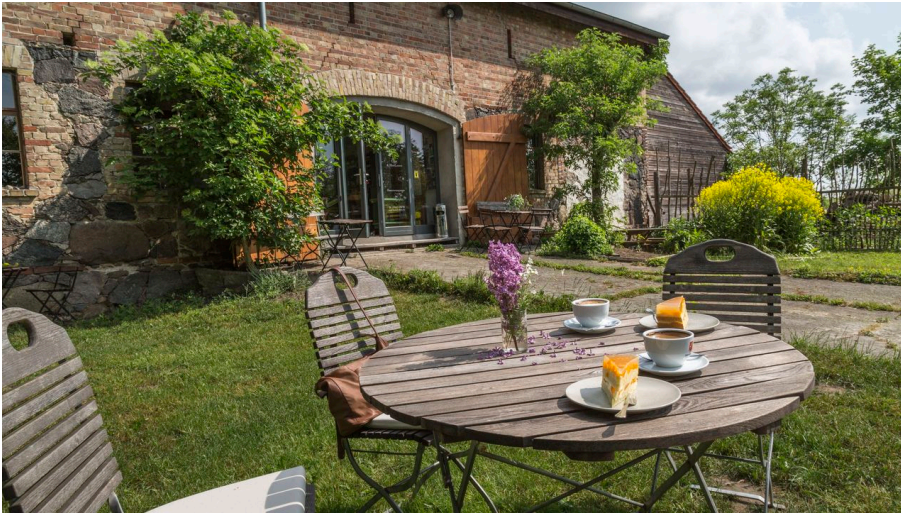
Biohof Ihlow