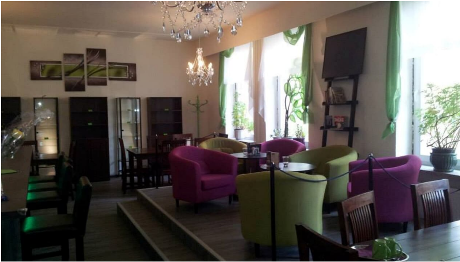
Kaffeetante - Gastrraum