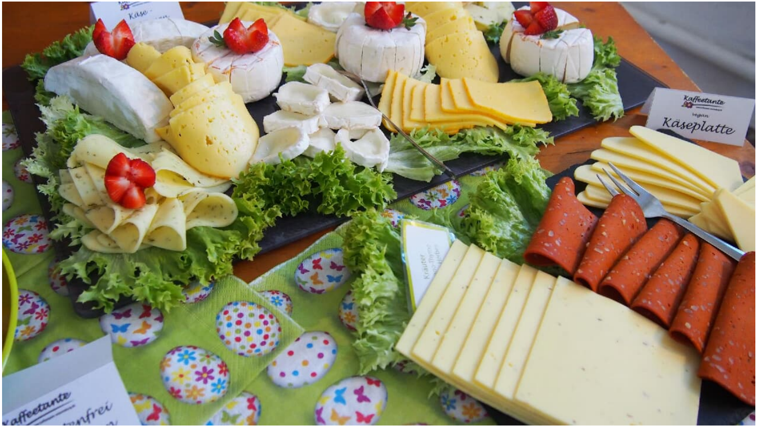
Kaffeetante - Buffet