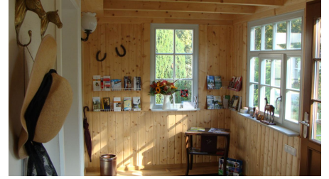
Schlossremise Steinhöfel - Veranda