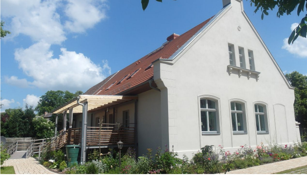
Schlossremise Steinhöfel - Blick aus dem Garten auf die Terrasse