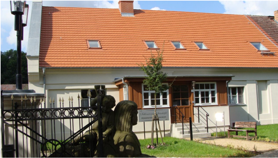
Schlossremise Steinhöfel - Pensionseingang