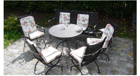
Schlossremise Steinhöfel - Sitzplatz im Garten