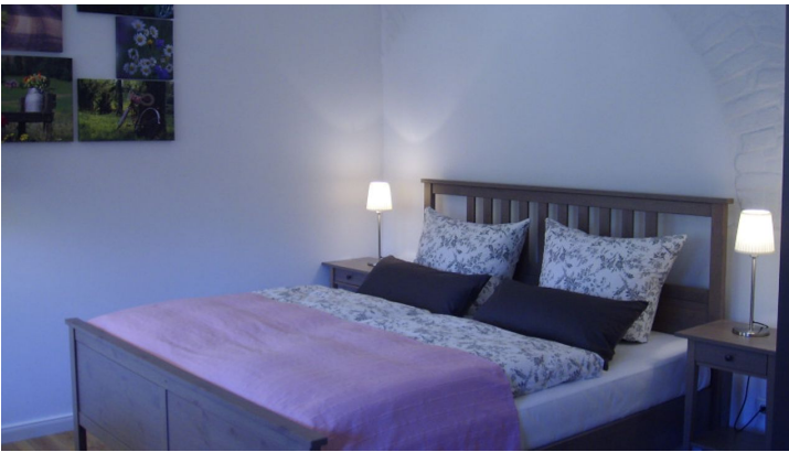
Schlossremise Steinhöfel - Fewo Ausspanne