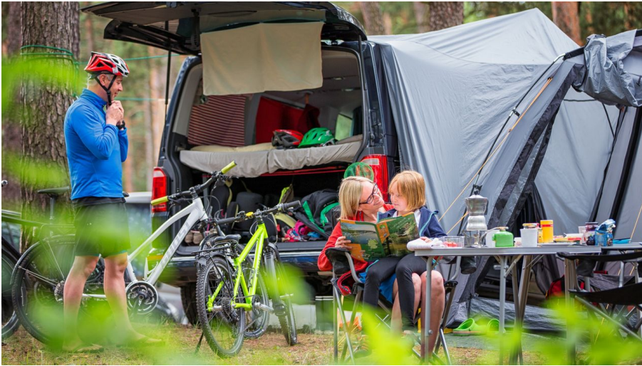
Camping im Seenland Oder-Spree