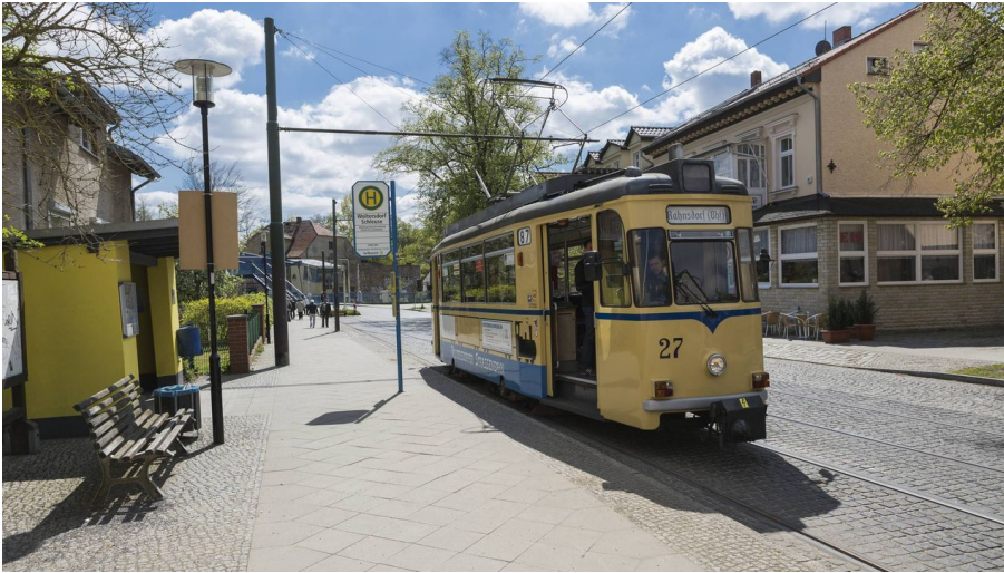
Woltersdorfer Straßenbahn

Historische Baudenkmäler und Stätten | Museen