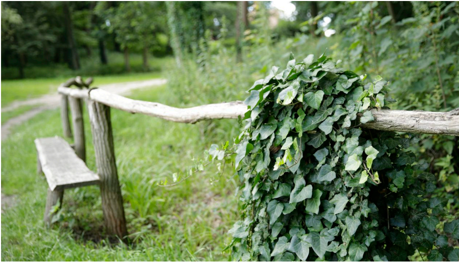
Park Reichenow