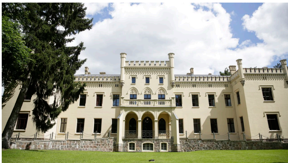
Schloss Reichenow