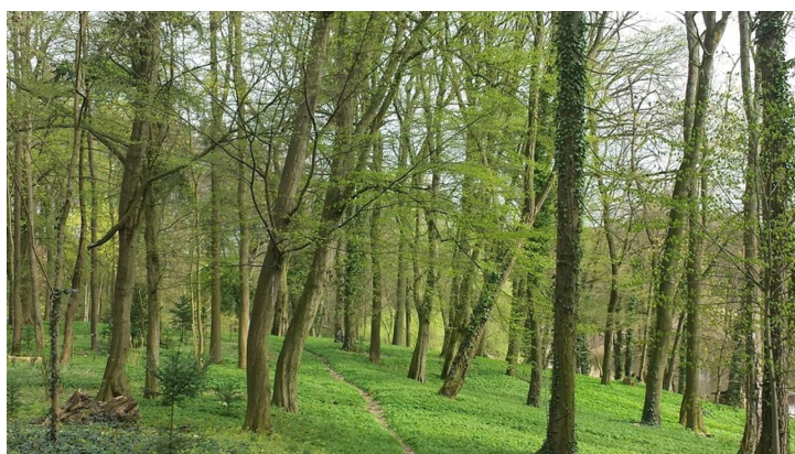
Park Reichenow