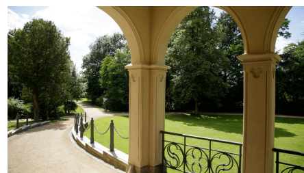
Blick in den Park Reichenow