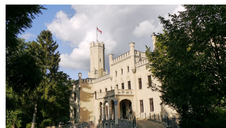
Schloss Reichenow