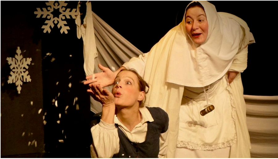
Szene aus Frau Holle - © Theater im Schuppen e.V./Frank Rad