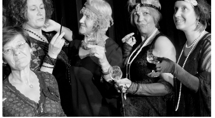
Szene aus Daddeldu - © Theater im Schuppen e.V./Frank Radüg