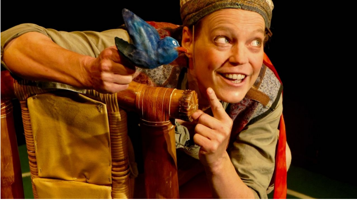
Schneider mit Vöglein