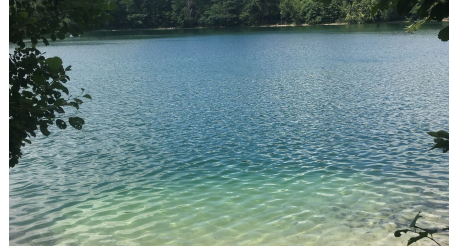
Straussee - © Seenland Oder-Spree e.V.