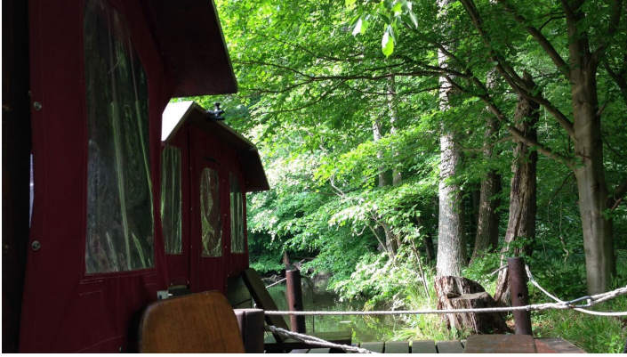
Huckleberrys Tour