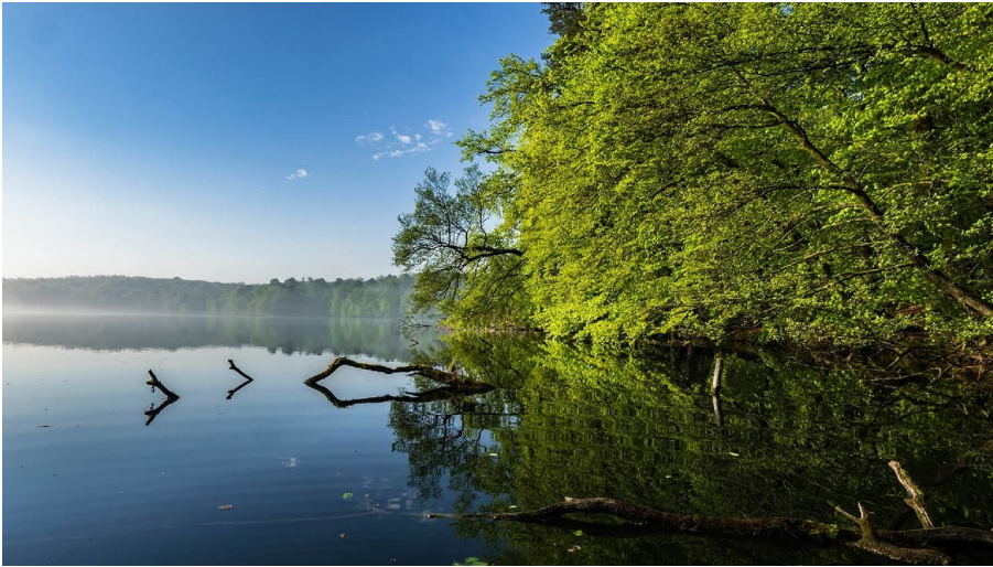
Huckleberrys Tour